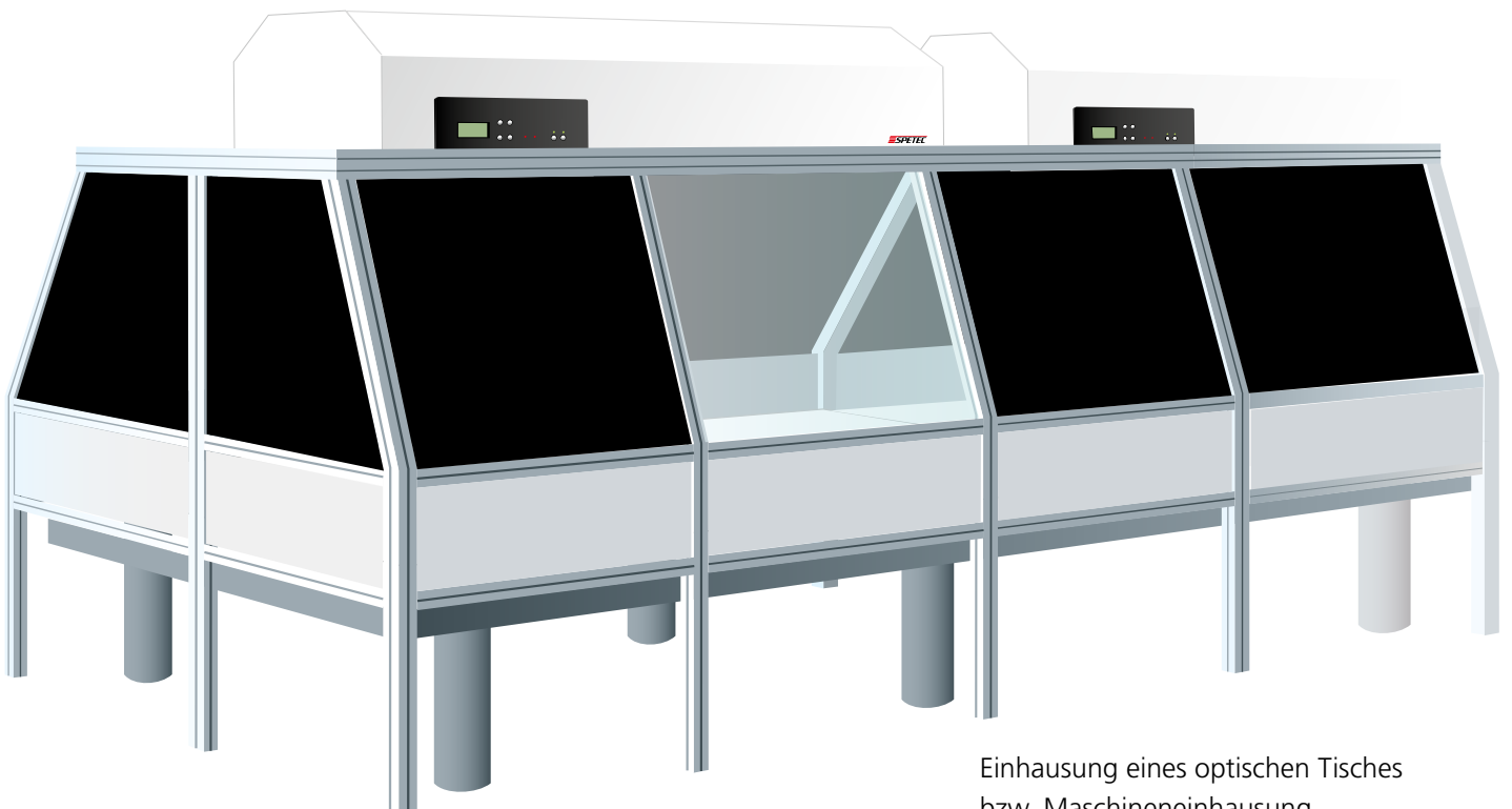
Einhausung eines optischen Tisches bzw. Maschineneinhausung

Im Bedarfsfall kann an die Decke der Einhausung ein Laminar Flow Modul (FFU) montiert werden, sodass innerhalb der Einhausung Reinraumbedingungen herrschen.