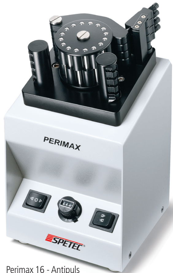
Perimax 16 - Antipuls

Die Perimax Peristaltische Pumpe findet ihre Anwendung in allen Bereichen der analytischen und präparativen Chemie sowie im Produktionsbereich: